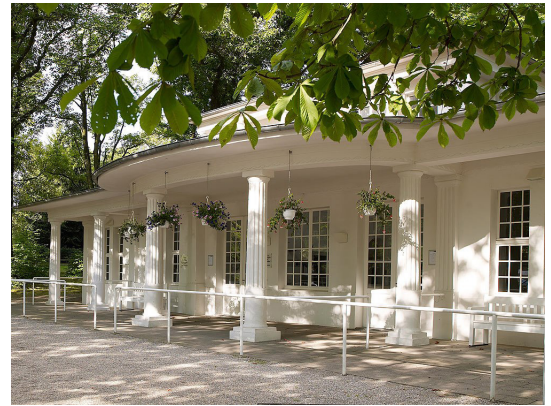
Außenansicht Alte Waage

Telefon 0211-5455580 Fax 0211-54555815 E-Mail a.zajonz@zack-bumm.net Website www.zack-bumm.net